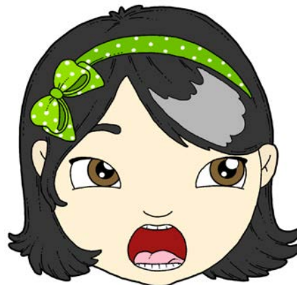
„ODKURZANIE” – PRZESUWANIE CZUBKIEM JĘZYKA PO WEWNĘTRZNEJ POWIERZCHNI DOLNYCH ZĘBÓW (OD LEWEJ DO PRAWEJ STRONY I Z POWROTEM).