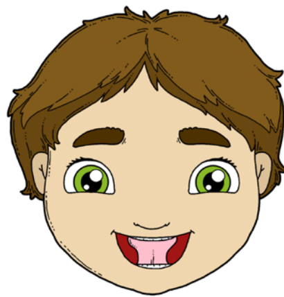
„KŁASKANIE” – NAŚLADOWANIE DŹWIĘKU KOPYT PORUSZAJĄCEGO SIĘ KONIA (ZE ZMIANĄ TEMPA).