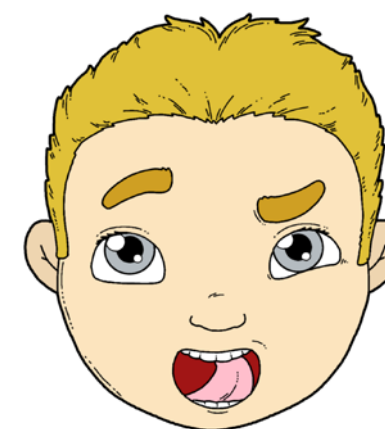
„LICZENIE ZĄBKÓW” – DOTYKANIE CZUBKIEM JĘZYKA KAŻDEGO ZĘBA PO KOLEI.