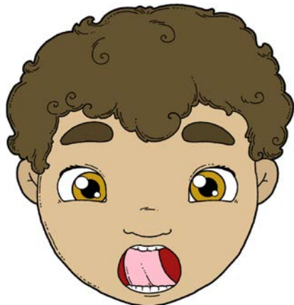
„MYCIE ZĘBÓW” – PRZESUWANIE CZUBKIEM JĘZYKA PO WEWNĘTRZNEJ POWIERZCHNI GÓRNYCH ZĘBÓW (OD LEWEJ DO PRAWEJ STRONY I Z POWROTEM).