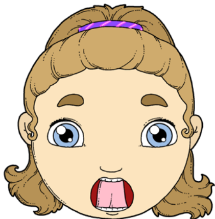
UNOSZENIE JĘZYKA ZA GÓRNE ZĘBY.