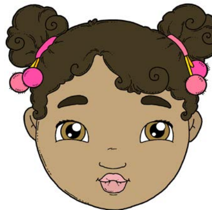
„DZIÓBEK” I SZEROKI UŚMIECH – NAPRZEMIENNIE.